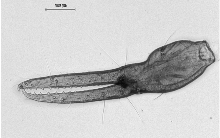
Abb. 1: Chthonius (Ephippiochthonius) nidicola Mahnert, 1979, linke Palpenschere des Weibchens von Bad Neuenahr. Foto: Interferenzkontrast mit Nikon H-III.

Fig. 1: Chthonius (Ephippiochthonius) nidicola Mahnert, 1979, left palpal chela of the female from Bad Neuenahr. The photograph was taken with the photomicrographic equipment Nikon H-III, using interference contrast with extended focus option (Digitaloptics, Jena).